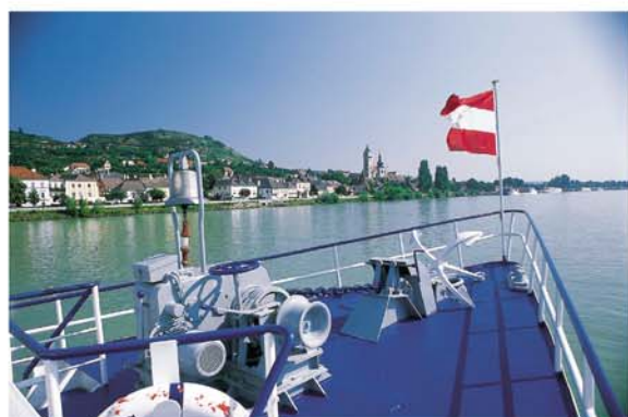
Grafik: www.werbewerbstatt-retz.at